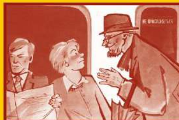
Ограничьте пребывание в местах скопления людей