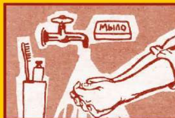
Регулярно мойте руки